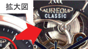
ゼンマイが巻かれている状態