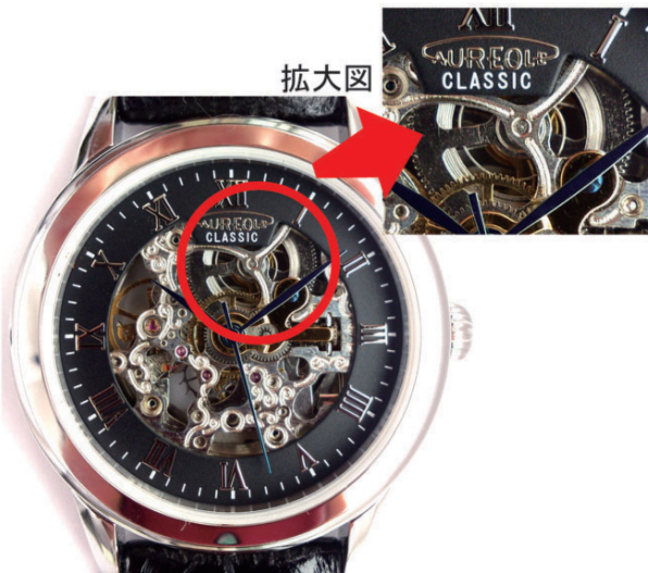
ゼンマイが巻かれていない状態 (この状態では駆動していません)