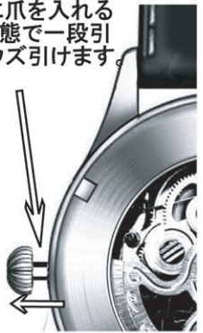
すき間に爪を入れるような状態で一段引くとリュウズ引けます。